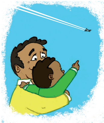
... ምርድዳክ ናይ ኢድ ምንቅስቃስ ተጠቐምካ