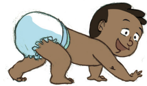
... ምምሃር ከመይ ኢልካ ከምተንፋፋሎኽ፡ ደው ትብልን ብኣግሪ ትኸይድን