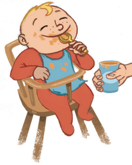
... ምድህላስ ነገራትን ናጻ ንምኳንን