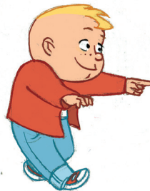
... ምድህላስ ዝሰፍሖ ዘሎ ከባቢታተይ