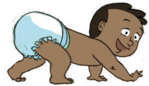
... ምምሃር ከመይ ኢልካ ከምተንፋፋሉኻ፡ ደው ትብልን ብኸግሪ ትኸይድን