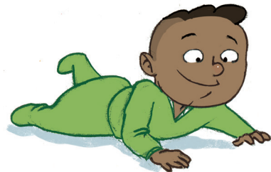
... ምምሃር ምቅደጻር ኣቃውማይን ምንቅስቃሳተይን