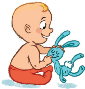
... ንምዕትዓት ነገራትን ብክኩም ምጽዋትን