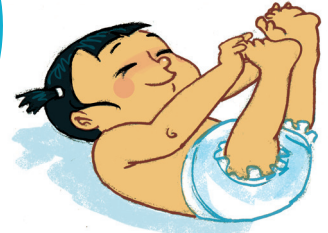
... ምድህሳስ ሰብነተይ