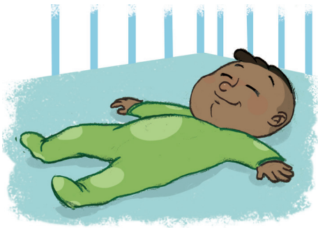
... ከዕርፍ ብድሕሪኡ