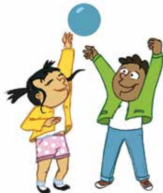
... ምምሃር ኣብ ጉጅለ ምጽዋት