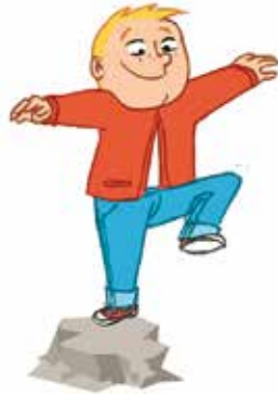
... ምቀጽጽር ምንቅስቃሳተይን ምምሕራም ስተይ ናይ ሚዛን ስምዒትን