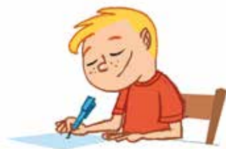
... ኣብ ቤት-ትምህርቲ ክቐልብ ክኸክል ምክንቲ