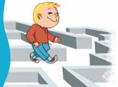
... ምህናጽ ናተይ ስፍራዊ-ግዝያዊ ምክዘና