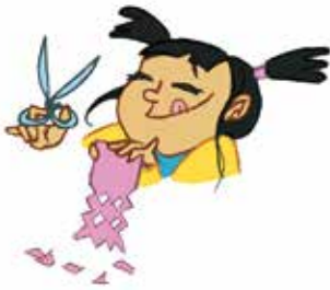
... ምምሕራም ስተይ ናይ ረቂቕ ሞተር ክክለታት